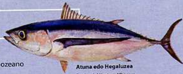
Atuna edo Hegaluzea Bonito del Norte o Albacora