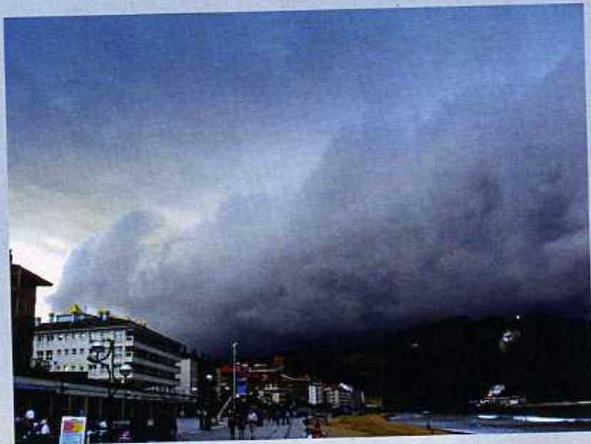
Galarrena Zarautzen Galerna en Zarautz

Harrezkero, hobekuntzak sartuko ziran nabigazioan (kubertak, eguraldi-iragarpenak, naufragoen salbamentua...) Hala ta guztiz be hurrengorik hurrengo galarrenetan barriro jazo ziran heriotzak. Beste galarren garrantzitsuak 1912koa eta 1961koa (83 biktima) izan ziran besteak beste.