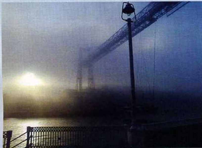
"Bizkaia" zubia galarrenapean

Itsaso zabaleko zein lehorreko guneei eragiten deusto.