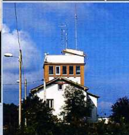
Igeldoko gaurko obserbatorioa