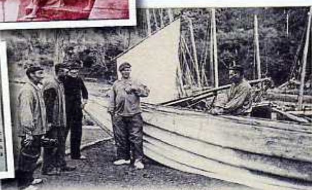
1902. ONDARROA. - Desfile del grupo

El jueves fueron botadas tres hermosas lanchas boniteras de cubierta, contruidas en los astilleros de la localidad. Entre las muchas personas que presenciaron la botadura, vimos algunos para el constructor por lo admirablemente terminadas que se hallan las embarcaciones y recogimos también frases de aprobación entre la gente marinera. Dios quiera que la temporada de junio a cuya pesca serán dedicadas las nuevas lanchas, sea fructifera para sus dueños y para cuantos a dicha pesca se dedican.