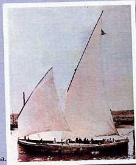
Bermeon eginiko azken txalupea, "San Francisco", 1917koa

Propultsino mekanikoaren eraginez, beladun ontziak desagertzen joan ziran gure portuetatik baporetatik ordezkatuak izanik. Baina Santa Klara gaueko Galarrenak arindu egin eban prozesua eta bela-arroaren amaiera markatu eban.