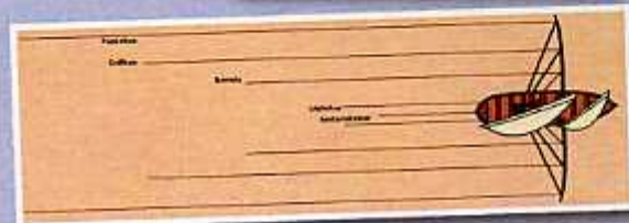
Txalupa baten atunetarako aparioen antolamendua Disposición de los aparejos boniteros de una lancha

Kosteran, txalupak talde edo konpainietan antolatzen ziran. Konpainiako txalupen eguneko harrapaketak taldeko txalupa edo bapore batek hartu eta erooten ebazan portura.