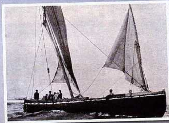
Txalupa bat itsasoan Lancha en la mar

Con la generalización de la propulsión mecánica, los veleros fueron desapareciendo de nuestros puertos sustituidos por vapores. La Galerna de la Noche de Santa Clara aceleró todo el proceso y marcó el fin de la era de la vela.