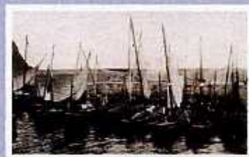
Txalupa bizkaitarrak Candás-eko portuan Lanchas vizcainas en el puerto de Candás

Algunas lanchas boniteras partían hacia Asturias (a Candás) a comienzos de Junio, esperando al bonito en su migración.