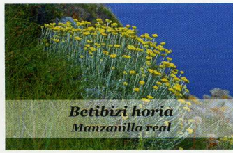
Betibizi horia Manzanilla real

Laga Hondartzan hasiko gara gure ibilbidea. Dunetatik paisai ederra ikusteko aukera izango dugu. Hemendik harea eta itsaso urdinaren arteko kontrastea disfrutatuko dugu marearen aldaketa bakoitzarekin. Hondartzatik Asnarre haitzaren oinarrian dagoen txaletaren bidea hartuko dugu. Heldu bezain laster eskumara doazen eskilara batzuk hartuko ditugu. Hemendik aurrera Elantxobeko lur-eremuan sartuko dugu.