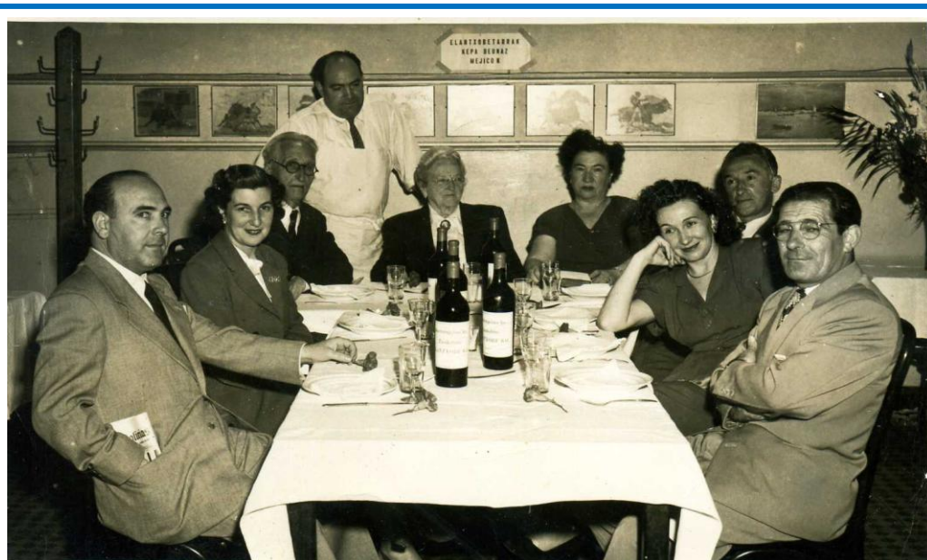
"Elantxobetarrak Kepa Deunaz Mejicon" dio mahaiburuko kartelak

Kafia hartutzen det egunian bi aldiz, baita pasiatu ere nik nahi aina zaldiz; jan edanaren faltik ez, osasuna berriz... Aita bizimodu hau Elantxoben izan balitz.